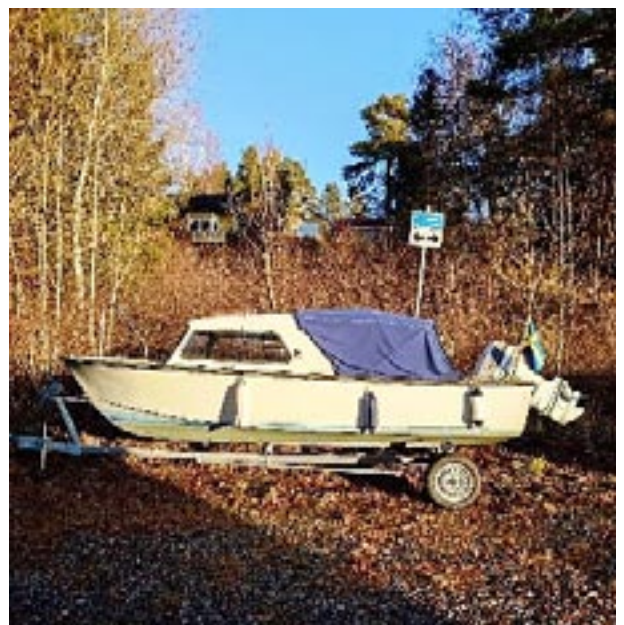
Den hemliga båten.